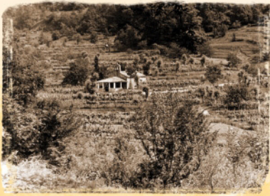
Crkva sv. Mihovila Saint Michael's Chapel Chiesetta di S. Michele Kirche des Hl. Michael

LOVRANSKA DRAGA je slikovito naselje smješteno unutar Parka prirode Učka. Do prije dvadesetak godina, stanovništvo Lovranske Drage intenzivno se bavilo poljoprivredom, naročito vinogradarstvom i stočarstvom. Osim loze, na plodnom se zemljištu uzgajalo povrće i voće od kojih su danas najvažniji trešnje i maruni. Raštrkane kućice povezane su starim putovima i stazama, no istaknutiji su oni koji vežu ruralnu Lovranštinu s dolinom Medveje i morem. Na prilazu Lovranskoj Dragi nalazi se barokna crkva sv. Mihovila, zaštitnika mjesta. Naselje je okruženo terasastim vinogradima i livadama te s najvišim vrhovima Učke u pozadini čini pejzažnu cjelinu od posebne vrijednosti.